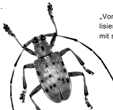
„Vorsicht, Gift!“ signalisiert dieser Bockkäfer mit seiner Farbe

Die Suche nach Arzneistoffen in Wildpflanzen ist schwierig, denn die Forscher wissen oft nicht, welche Arten solche Substanzen enthalten. Künftig könnten ihnen Käfer helfen. Wie Biologen des Smithsonian Tropical Research Institute in Panama herausfanden, suchen vor allem bunte Exemplare 1 Pflanzen auf. Sie nehmen daraus Giftstoffe gegen Fraßfeinde auf und zeigen mit auffälliger Färbung ihre Toxizität an.