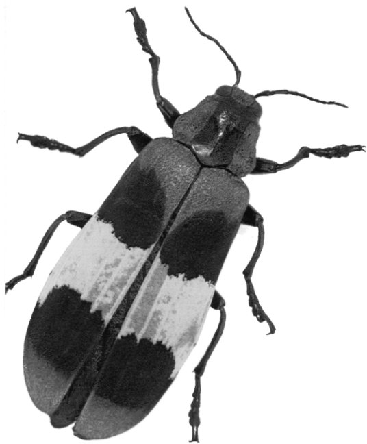
Bunte Käfer können als Wegweiser zu Medizinpflanzen dienen

Die Suche nach Arzneistoffen in Wildpflanzen ist schwierig, denn die Forscher wissen oft nicht, welche Arten solche Substanzen enthalten. Künftig könnten ihnen Käfer helfen. Wie Biologen des Smithsonian Tropical Research Institute in Panama herausfanden, suchen vor allem bunte Exemplare 1 Pflanzen auf. Sie nehmen daraus Giftstoffe gegen Fraßfeinde auf und zeigen mit auffälliger Färbung ihre Toxizität an.